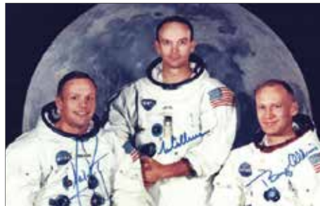
LOS ASTRONAUTAS QUE LLEGARON A LA LUNA