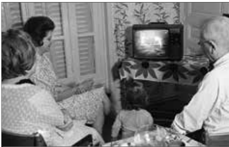
LA LLEGADA DEL HOMBRE A LA LUNA VISTA POR TV

Luego intentá ubicarlas en la próxima página