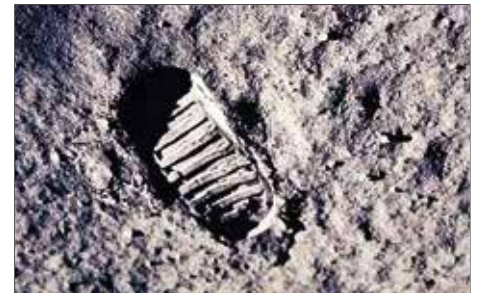
PISADA EN LA LUNA