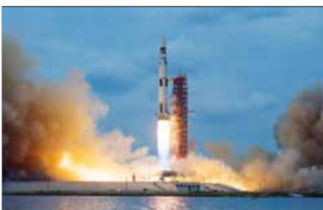
DESPEGUE DE APOLLO 11